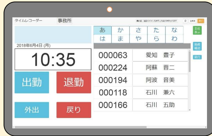
顔写真による本人確認ができるのでカードなどの認証が不要です