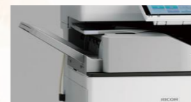
インナー紙折リユニット折

生産性革新を後押しさせていただきます！ 手間のかかる日々の業務は、デバイスやアプリで効率化しませんか？ ファイルの一元管理を簡単操作で実現！ドキュメントをクラウド管理すれば、チームの連携がスムーズに。FAXを外出先でも確認でき、働き方改革にも対応します！