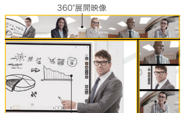
固定クローズアップ 話者クローズアップ

専用アプリから映像の方向やズームを設定できるので、ホワイトボードや特定の人物を常時拡大して表示することができます。